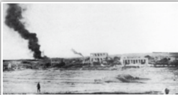
Il-Junkers Ju88 li kkraxxa fin-Naval Firing Range tal-Kamp ta' Għajn Tuffieħa.

Xahrejn wara, fit-12 ta' April 1941 gie rrapurtat li fil-10.40pm waqgħu bombi 'il barra mill-Qammieħ, filwaqt li l-għada ajruplani tal-għadu waddbu bombi fl-inħawi tal-Bajja tal-Għadira. Fid-29 ta' April għal ħabta tas-7.30pm waqt attack mill-ajru, kanuni ta' kontra l-ajruplani bdew jisparaw fuq ajruplani tal-għadu, wieħed minnhom, tat-tip Junkers Ju88 mid-9/LG 1 intlaqat u beda jaqbad. Il-bdoti qabzu bil-paraxut u kollha nqabdbu minnufih, mentri l-ajruplan ikkraxxa fin- Naval Firing Range tal-Kamp ta' Għajn Tuffieħa. 4 Gie rrapurtat ukoll