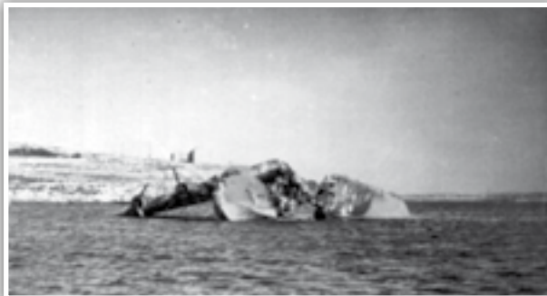
Sunderland L2164 maqsum fi tnejn.

Tliet ijiem wara, reġgħu tfaċċaw ajruplani tal-għied tal-għadu fejn din id-darba għamlu attack iktar determinat. Messerschmitts ittajru fil-baxx u immaxingjaw Sunderland T9046, qabel ma reġgħu dawwru harsithom lejn L2164, fejn din id-darba safa attackat serjament u thalla jaqbad. Sar attentat biex l-ajruplan jingibed lejn il-bajja, però kien kollu għalxejn għax leħaq għereq f'baħar baxx. 3