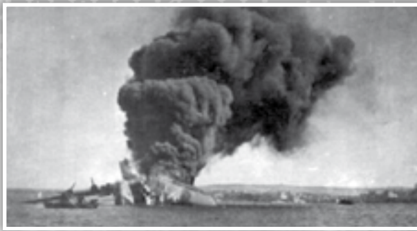
Sunderland L2164 jaqbad.

mall-ewwel mar fuq wieħed mill- machine-guns Vickers K tal-istess ajruplan, fejn ipprova jwaqqa' l-ajruplan, li però wassal minflok għall-mewt tiegħu fil-post fejn kien.