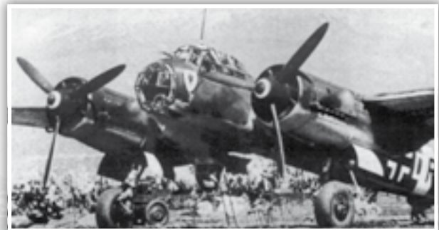
Junkers Ju88 f'ajrudrom fi Sqallija.

Fl-aħħar gurnata tal-istess xahar, il-31 ta' Jannar 1942, ajruplani tal-għadu waddbu sittax-il bomba