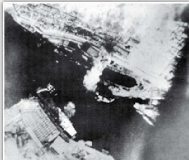
Ritratt ta' attackk fuq HMS Illustrious meħud minn fuq ajruplan Germaniż.

Dan l-artiklu se jkompli mal-ewwel wieħed, li deher sentejn ilu fejn kien jitratta attackki li saru fuq il-Mellieħa matul l-1940.