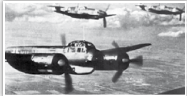
Junkers Ju88 eskortat minn żewġ Messerschmitt Bf109Fs fi triqithom biex jibbumbardjaw lil Malta.

Matul ix-xahar ta' Mejju, elementi minn Fliegerkorps X bdew iħallu Sqallija, uħud lejn il-Libja u l-kumplament taru lejn l-Ewropa tal-Lvant biex jippartecipaw fl-Invazjoni mill-Assi tal-Unjoni Sovjetika, li bdiet fit-22 ta' Ġunju. Matul ix-xhur tas-sajf ir- Regia Aeronautica kompliet wehidha bl-attakki tagħha fuq Malta, però l-Ġermaniżi kellhom jereġgħu jirritornaw lejn Sqallija għall-aħħar tal-1941, din id-darba Fliegerkorps II kellha l-ordni biex tinnwtralizza lil Malta. Għall-aħħar tal-1941 naraw li fit-23 ta' Novembru twaddbet bomba f'Tal-Migduma, li però ma splodietx.