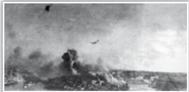
Junkers Ju87 Stuka jiddajvja fuq l-Isla.

Għall-aħħar ta' Dicembru 1940 elementi minn Fliegerkorps X ġew trasferiti fi Sqallija sakemm il-korp tal-ajru Germaniż kien preparat biex jibda l-ħidma tiegħu kontra l-gzejjer Maltin. L-Assi saru