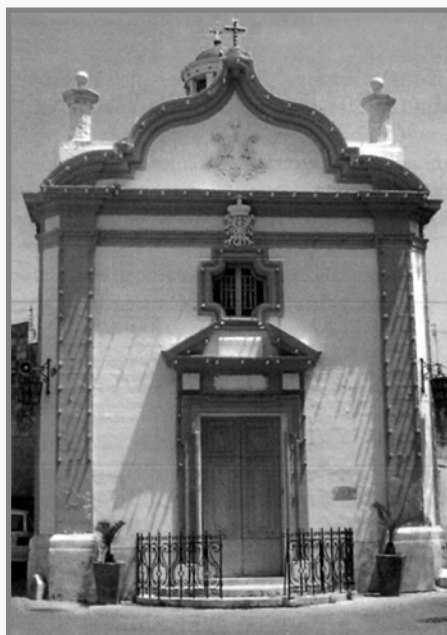
Il-Knisja tal-Vitorja f'Has-Sajjed Birkirkara