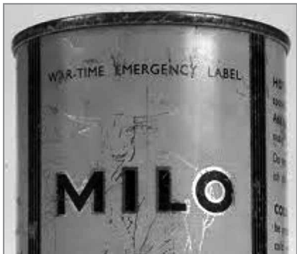
Il-Milo – kien jingħata lil tfal dgħajfa u foqra.

Il-logbook jagħti informazzjoni wkoll dwar