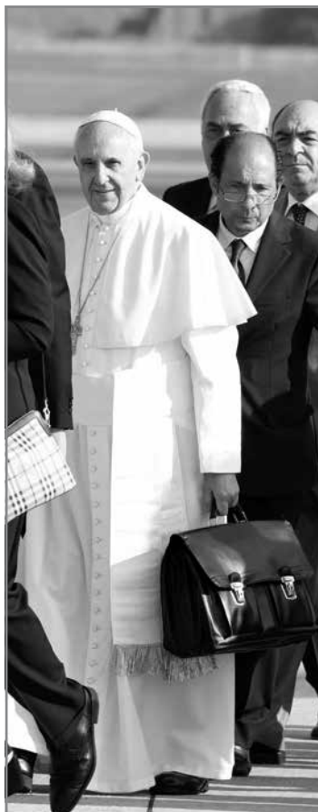
Kif jgħid il-Malti: min jerfa' qofftu mhux pastaż!

"Inti staqsejtni jekk Alla tal-insara jaħfirx lil min ma jemminx jew ma jfittixx il-fidi. Nibda