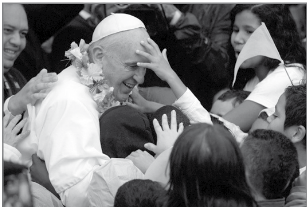
Frangisku – l-għaxxa tiegħu qalb in-nies.

Mhix haġa ta' kuljum li Papa jikteb ittra f'gazzetta. Soltu l-Papa jibgħat ittri formali lil kardinali u isqfijiet bil-għan ta' xi ħatra, jew dwar xi suġġett preċiż jew f'xi okkażjoni jew oħra. Nafu wkoll b'ittri aktar importanti, l-ittri enċikliċi li l-Papa jikteb minn żmien għal żmien biex jgħallim aktar dwar xi verità tal-fidi. Ittri bħal dawk ikollhom fihom ħafna studju li tkun għamlet kummissjoni apposta mqabbda mill-Papa biex tiżviluppa b'mod dottrinali l-ħsieb tal-Papa biex joħroġ dik l-ittra