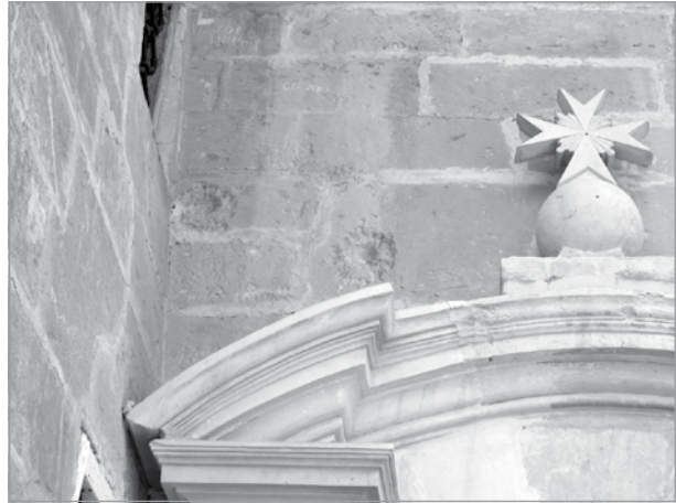
Żewġ marki tal-balal 20mm fuq il-kappella tal-Palazz. Dawn ġew sparati minn ME 109. Balla oħra laqtet il-pittura ġol-kappella.

Jista' ikun li rapport li sar nhar 24 ta' Marzu, 1942, li fil-Palazz ta' Selmun u fil-kappella kienu