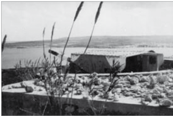
Wieħed mill-kanuni 6 inch tal-Fortizza Campbell.