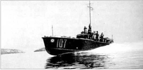
HSL 107 diehla lura fil-port ta' San Pawl il-Baħar.

kontroll tal-ajruplan li għodos b'velocità qawwija lejn il-baħar.