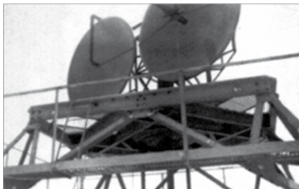
Ir-radar tal-Fortizza Campbell.

Campbell kienet mgħammra b'radar qawwi li kien kapaċi juri fuq l- iscreen tiegħu l-biċċiet tal-baħar minn Għawdex sal-Port il-Kbir, anke bil-lejl. Ta' min ifakkar li madwar il-fortizza kien hemm is- searchlights li setgħu jdawlu l-baħar halli jikxfu l-vapuri tal-għadu li kienu fil-qrib. Il-qawwa ta' dan ir- radar kienet twaqqaf l-arloġġi tal-idejn tas-soldati kif ukoll dawk li kienu mdendlin mal-ħitan fil-bini tal-fortizza. Allura s-soldati li kien għaddielhom ix-xift kienu jindunaw li kien sar il-ħin meta jaraw lil shabhom ġejjin jibdluhom.